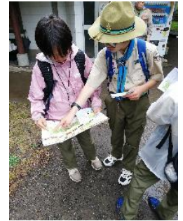
小雨決行！★清瀬2団班★ BSラリースタート！