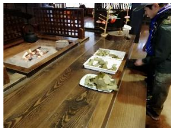
古民家で、美味しい柏餅をご馳走になりました。