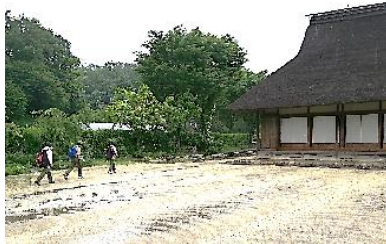
第2ポイント里山民家到着！