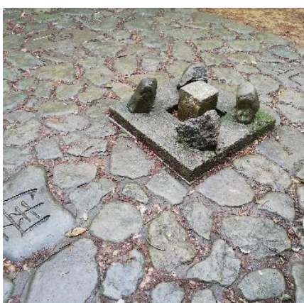
12時に展望台集合！あと30分しかない… やっと三角点を発見！間に合うかと焦る清瀬2班