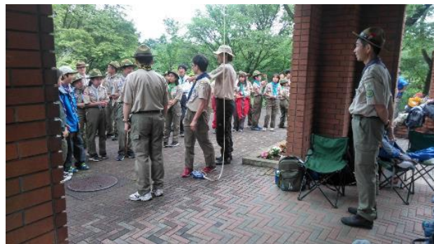
展望台の高さは 13.1mでした