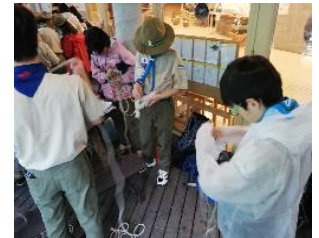
ベンチャー隊からの指導！ロープワークに挑戦する