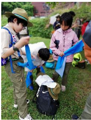
救急法(三角巾で包帯の巻き方に挑戦)に苦戦している様子を見られないリーダーが丁寧に教えてもらいました。