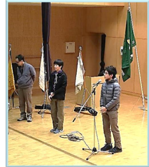
観た感想を発表しました。