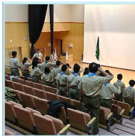
↑ 閉会セレモニーの様子 ↑