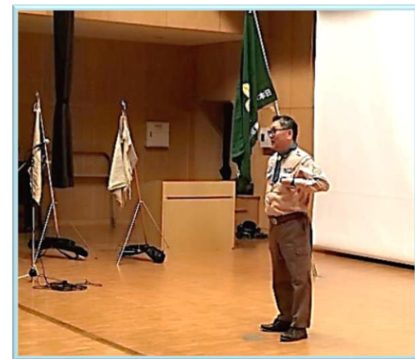
↑ 開会セレモニー（隊長のスピーチ）