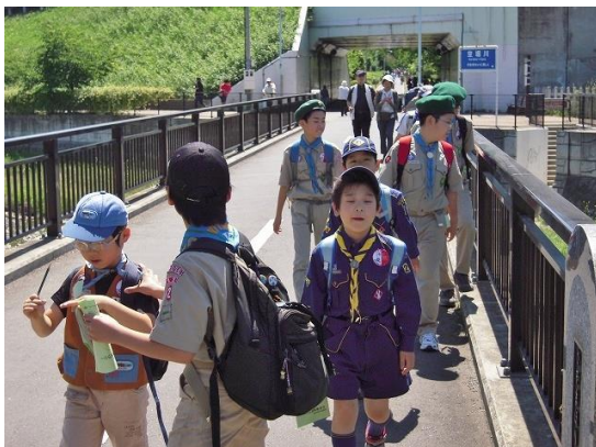
暑い中でのウォークラリー

★清瀬に着くまでビーバー隊の面倒を見てくれたカブ、ボーイの先輩スカウト達。本当にありがとう。 同行して下さった団委員長さん、保護者の皆さん、ありがとうございました。